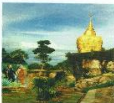
วัดบ้าน บ้านดงมะไฟ