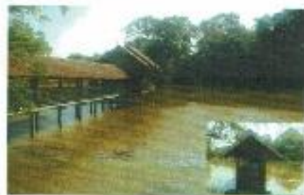
วัดบ้าน บ้านดงมะไฟ