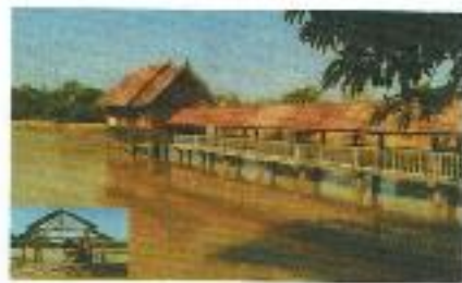
วัดบ้าน บ้านดงมะไฟ