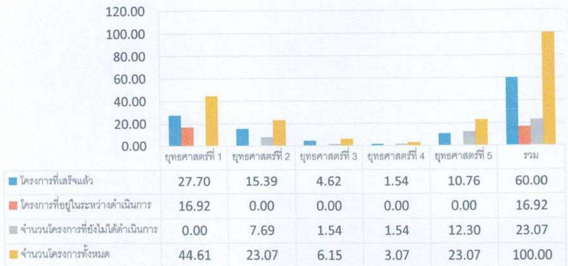
แผนภูมิแสดงผลการดำเนินงานตามแผนพัฒนาท้องถิ่น พ.ศ.2565 โดยคิดเป็นร้อยละของจำนวนโครงการ