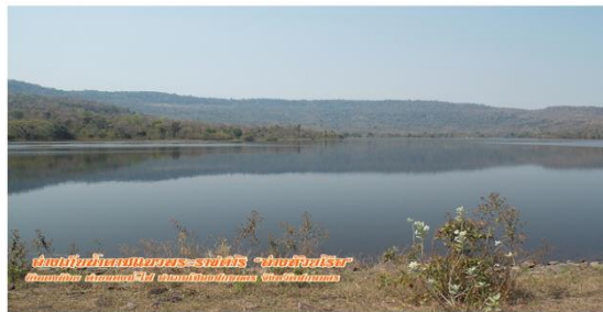
เขื่อนป่าสักชลสิทธิ์-สถานี "ดงมะไฟ" (เขื่อนป่าสักชลสิทธิ์) บ้านดงมะไฟ ตำบลดงมะไฟ อำเภอเมืองบึงกาฬ จังหวัดบึงกาฬ