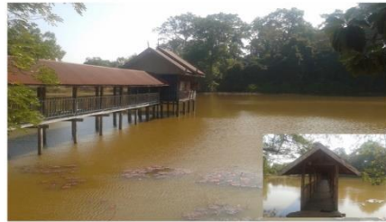
ลิมน้ำโบราณ บ้านโพนแดง หมู่ที่ ๘