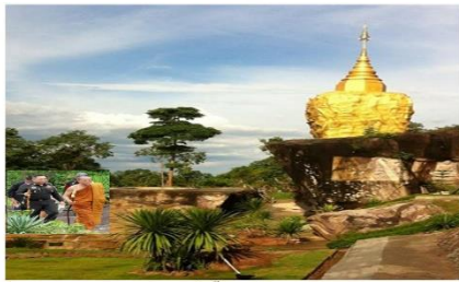
วัดถ้ำผาแดน บ้านดงน้อย หมู่ที่ ๔