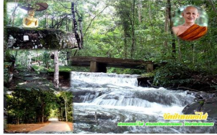
น้ำตกเขื่อนป่า บ้านหนองไผ่ หมู่ที่ ๑