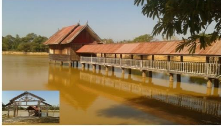
ลิมน้ำโบราณ บ้านหนองไผ่ หมู่ที่ ๑