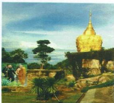
วัดนาตาล บ้านหนองไผ่ หมู่ที่ ๘