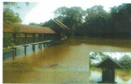
สิมน้ำโบราณ บ้านโพนแดง หมู่ที่ ๘